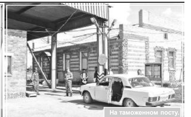
На таможенном посту.