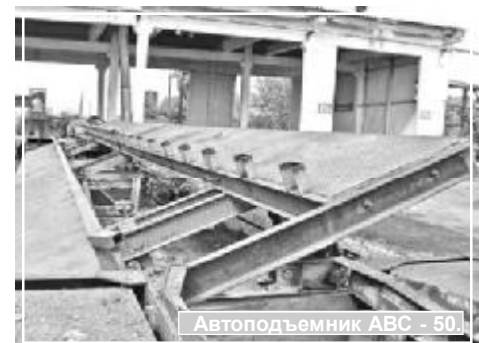
Автоподъемник АВС - 50

действительность просто подталкивает нас наверстывать упущенное время. Мы уже мечтаем об установке у себя новой современной итальянской мельницы, монтаже комбикормового завода. В будущем обязательно будем выходить на прямые контакты с западными партнерами по поставке за границу твердых сортов пшеницы, пользующихся там особым спросом.